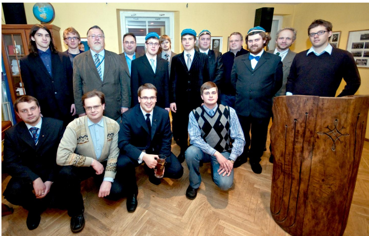
Austrumieši ar EŪS biedriem