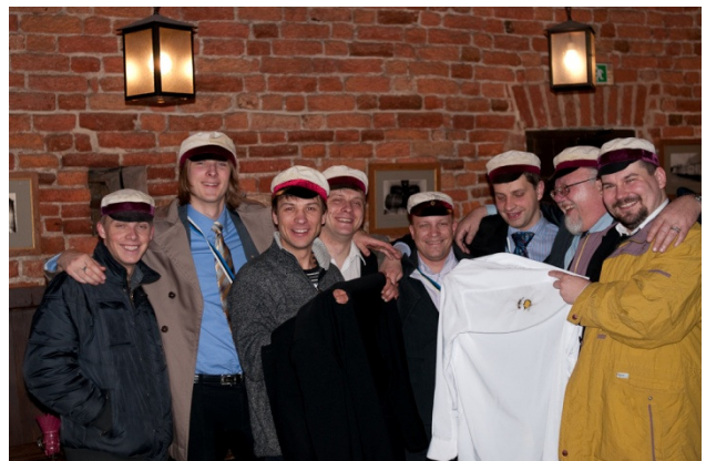
austrumieši EUS svētkos